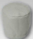
Филтър за сухо почистване